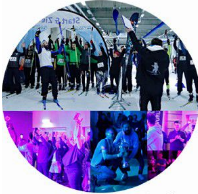
Finale der Etappensieger in Oberhof