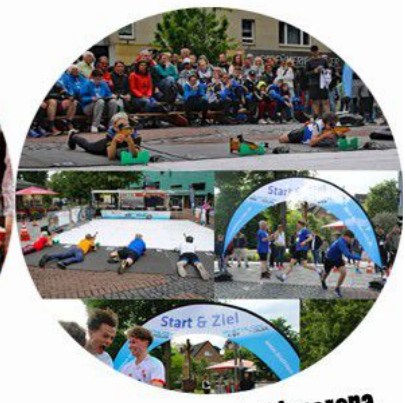
Tolle mobile Biathlonarena bei Ihnen vor Ort