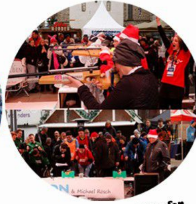
Mitmachen und wettkämpfen für Jedermann