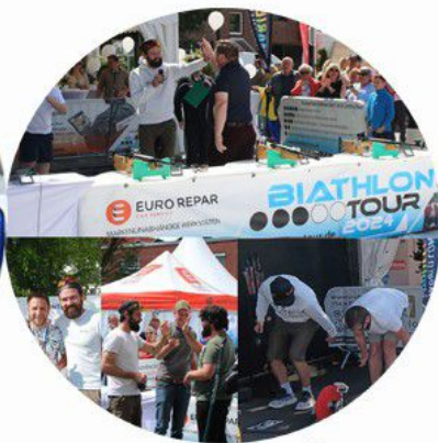
Trainingscamp bei Olympiasieger Michael Rösch