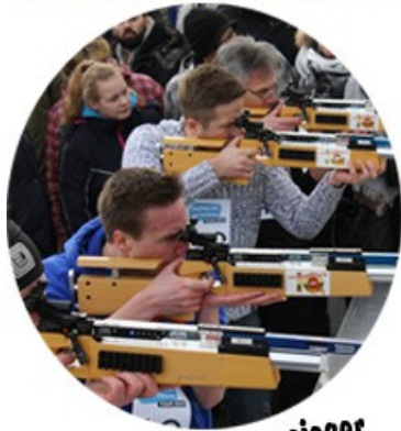
Finale der Etappensieger in Ruhpolding