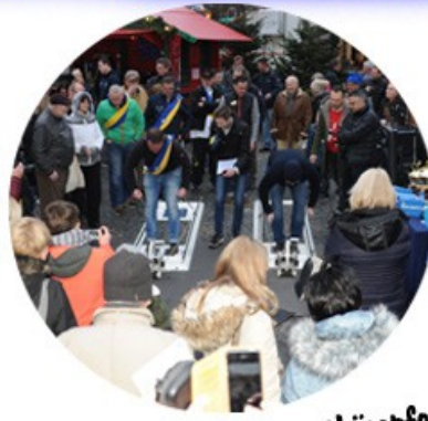
Mitmachen und wettkämpfen für Jedermann