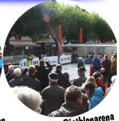
Tolle mobile Biathlonarena bei Ihnen vor Ort