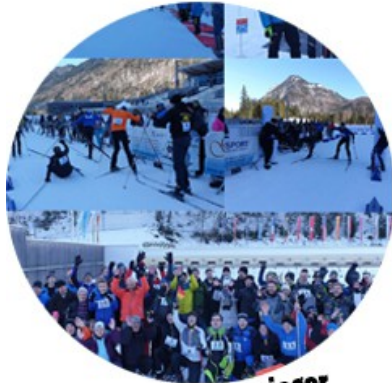
Finale der Etappensieger in Oberhof