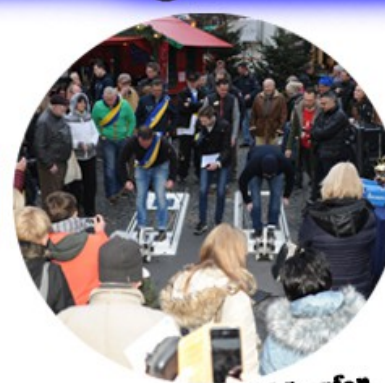
Mitmachen und wettkämpfen für Jedermann