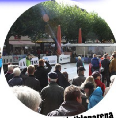
Tolle mobile Biathlonarena bei Ihnen vor Ort