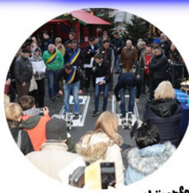
Mitmachen und wettkämpfen für Jedermann