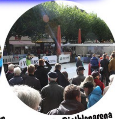
Tolle mobile Biathlonarena bei Ihnen vor Ort